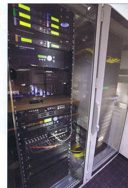
Die Technik ist ordnungsgemäß untergebracht.