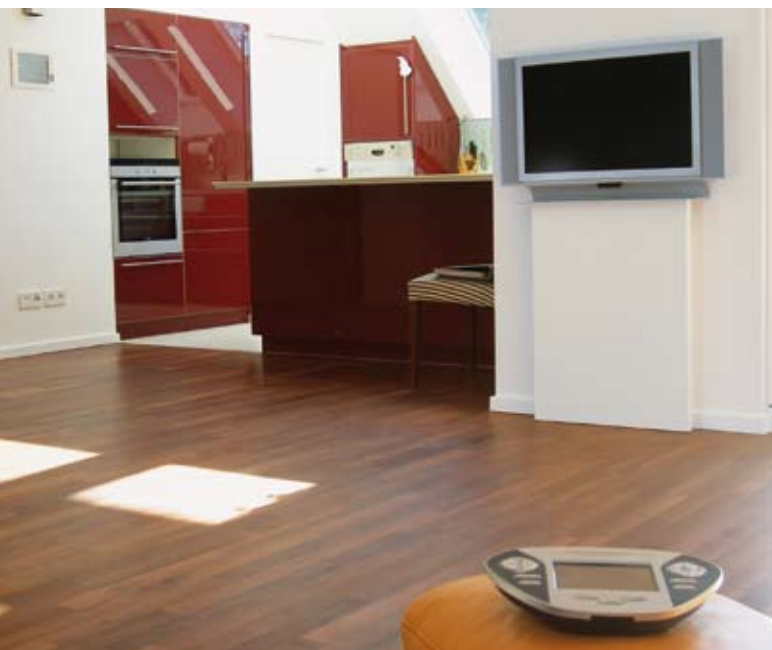
Griffbereit: das MT-1000 C Funktouchpanel von Crestron