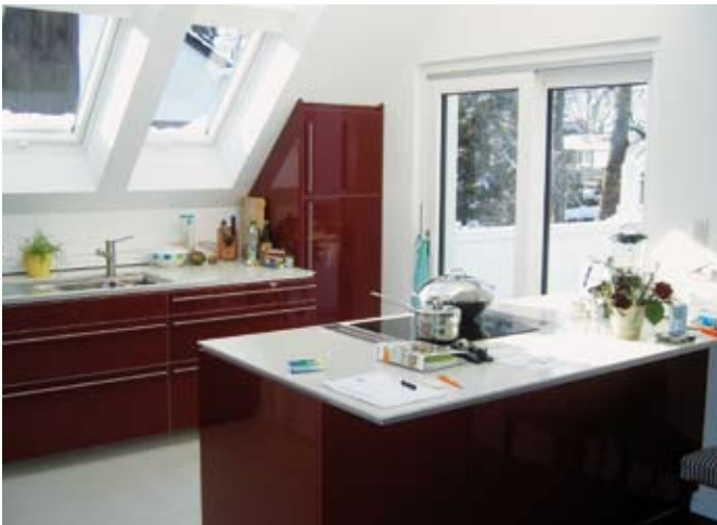
Cool: Das Induktionskochfeld

Mehr denn je sind ressourcenschonende und umweltverträgliche Systeme zur Energiegewinnung gefragt. Max64, das Münchner Vorzeigeprojekthaus der gerade zu Ende gegangenen ISE - Integrated Systems in Amsterdam – vereint eine attraktive und zeitgemäße Architektur mit State-of-the-Art-Technologie.