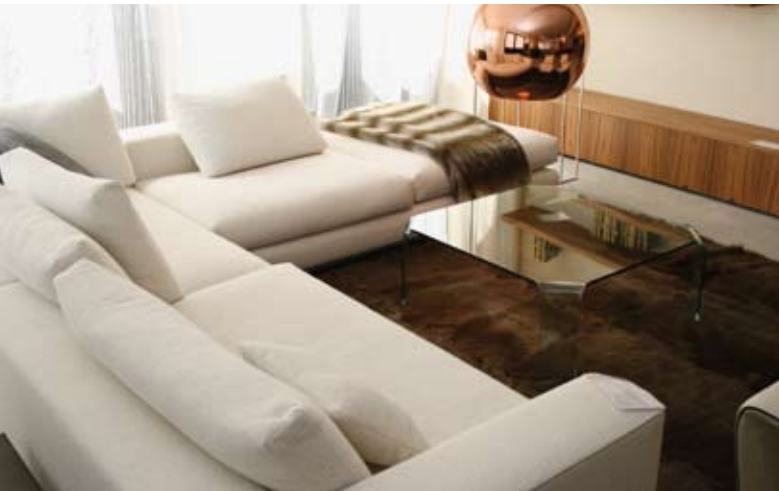
Wohlfühlatmosfera im Wohnzimmer garantiert