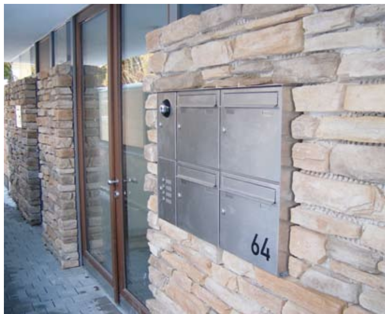
Diskret: TV-Überwachung des Eingangsbereichs

„Schaltzentrale“ ist das Wohn-/Esszimmer seiner 146 qm großen Wohnung, zu der eine kleine Dachgeschosswohnung nebst Galerie gehört. Das zentrale Touchpanel TPS 4000 im Wohnbereich steuert, kontrolliert und kommuniziert, eine funkbasierende Steuerung und sieben Wandbedienstellen ergänzen das System. Integriert ist die Temperaturanzeige und die Steuerung der Heiz- und Kühlkreisläufe, die Steuerung der Zu- und Abluft, die Visualisierung und Steuerung der Beleuchtung, die Steuerung von Sonnenschutz und Verdunklung, Statusinformationen durch geöffnete Terrassentüren über Kontaktmelder sowie eine Information über den Status der Wärmepumpe.