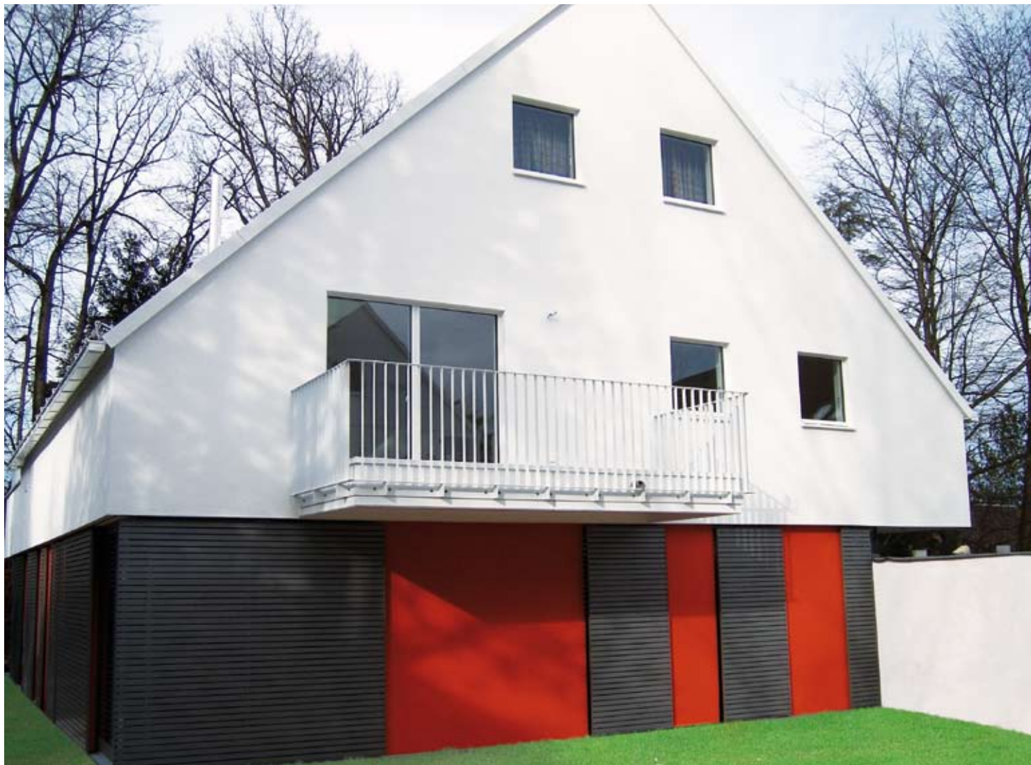
Die weißen Obergeschossbaukörper mit ihren 45 Grad steilen Satteldächern scheinen förmlich über den Erdgeschossen zu schweben