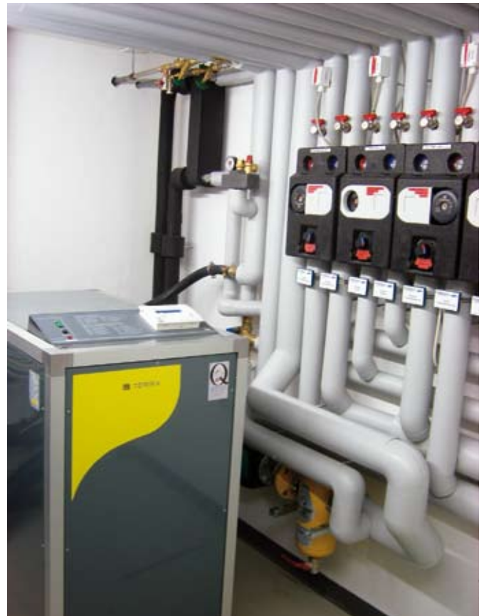
Hot: Mit Erdwärme heizen und Warmwasser bereiten

Die Lüftungswärmeverluste werden außerdem durch den Einsatz ökologischer Baustoffe mit guter Wärmedämmung sowie Fensterscheiben aus hochwertigem Isolierglas mit einem U-Wert von 1,1 bis 1,2 minimiert. Auch die Dachfenster sind nach Süden hin mit Sonnenschutzverglasung versehen, die nur eine relativ begrenzte